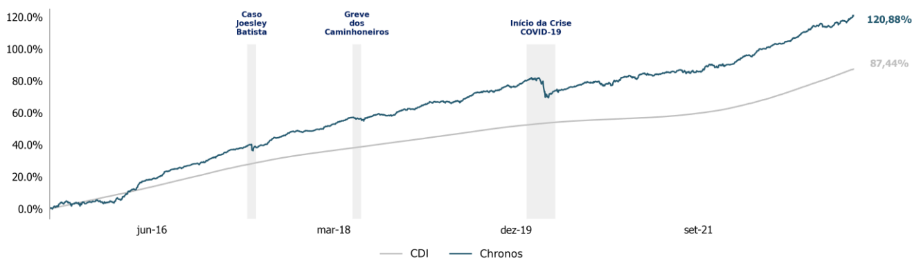
RETORNO ACUMULADO DESDE O COMEÇO

* O Índice de Hedge Funds ANBIMA apresenta a evolução dos fundos de multimercado de gestão ativa.