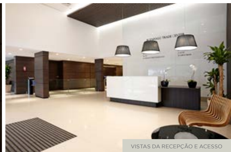
VISTAS DA RECEPÇÃO E ACESSO