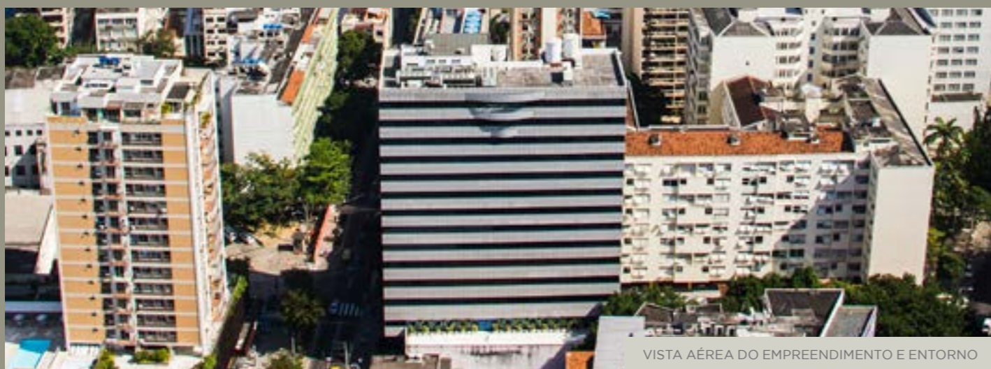
VISTA AÉREA DO EMPREENDIMENTO E ENTORNO