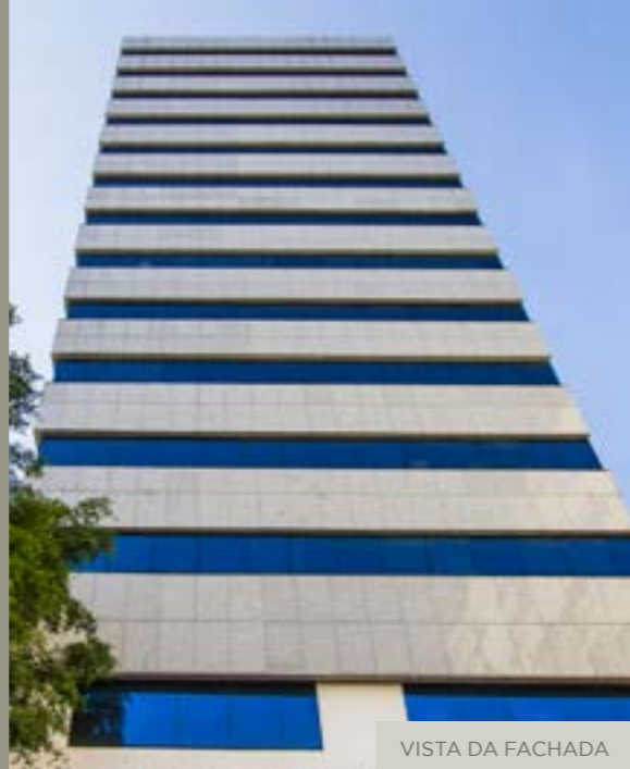
VISTA DA FACHADA

Situado à Rua Professor Álvaro Rodrigues, 352, conta com uma segunda frente para a Rua Voluntários da Pátria, 113, ambas importantes vias do bairro de Botafogo, um dos mais tradicionais e conhecidos da cidade do Rio de Janeiro.